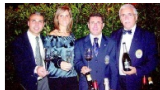
FOTO DI GRUPPO

propri migliori prodotti: dai salumi senza glutine, ideali per i celiaci, ai vini biologici fino ai funghi champignon . Il tutto annaffiato dai pregiati vini rossi e bianchi del territorio. Da qui, il gustoso 'matrimonio' tra Nh e specialità locali. Continuando in questo ideale percorso attraverso le gioie del palato, domenica prossima da non perdere l'ultimo appuntamento della Sagra del Marrone di Castel del Rio (Bologna), tra stand gastronomici, gare di dolci e mostre. Info: www.marronedicasteldelrio.it ; tel. 0542.95984.